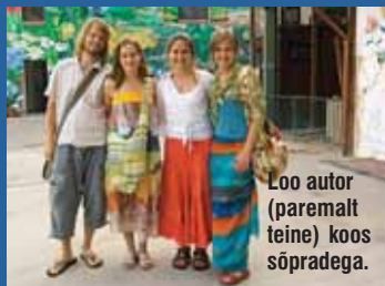
Loo autor (paremalt teine) koos sõpradega.

Ma küll ei küsinud oraaklilt midagi, ent tundsin, et sain vastused kõigile oma küsimustele. “Võta aega endale, maali, tee asju, mis sulle meeldivad, hoolitse oma tervise eest” – need olid minu enda seest väljakasvanud vägagi asjakohased oraaklisõnumid, mille eest olin väga tänulik.